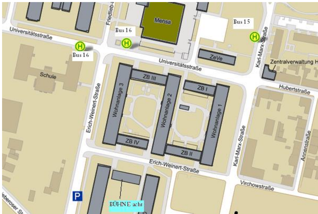
Abbildung 2: Campusplan mit BÜHNE acht

Von dort zu Fuß Richtung Süden gehend (1 Minute Fußweg) finden Sie uns im 3. Flachbau zwischen den Studentenwohnheimen.